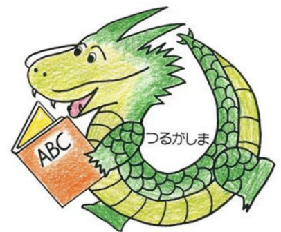
鶴ヶ島市立図書館