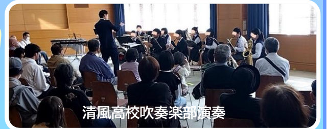
清風高校吹奏楽部演奏