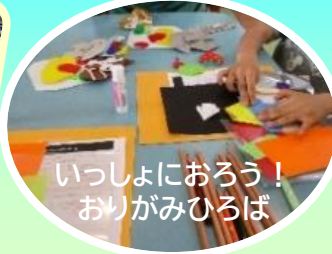
いっしょにおろう! おりがみひろば