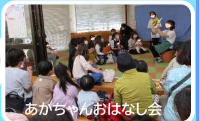
あかちゃんおはなし会