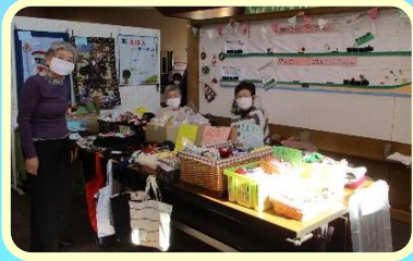
ろんちゃんマーケット