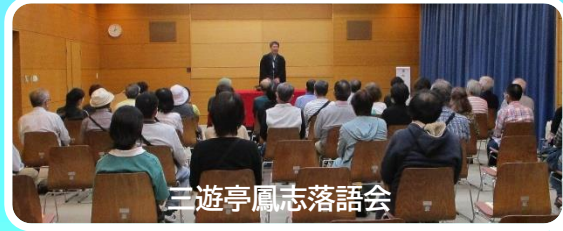
三遊亭鳳志落語会