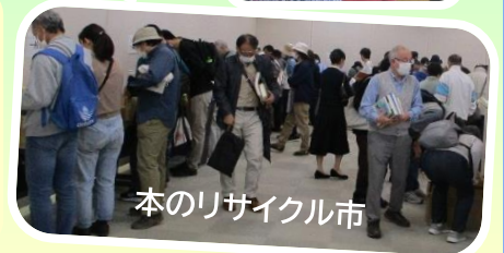
本のリサイクル市